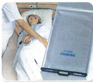
SAMARIT Rollbord Hightec

Verlangen Sie auch die separaten Broschüren weiterer Produkte von SAMARIT!